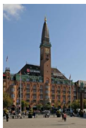
Palace Hotel Copenhagen

Beliggenhed: Central beliggenhed i centrum af København tæt på byens attraktioner og i gåafstand til Strøget.